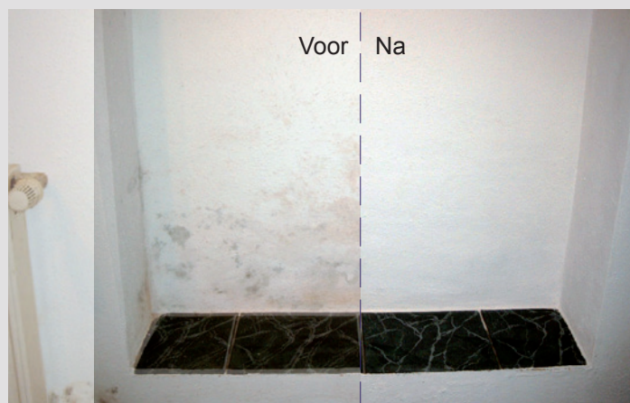
KefaRid weert schimmels op duurzame wijze

Gebruik: KefaRid is gebruiksklaar en laat zich verwerken als een verf, machinaal met airless of met borstel/rol. De standaardkleur is wit. KefaRid kan echter met wateroplosbare dispersiekleurstoffen bijgekleurd worden.