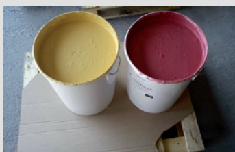
KefaRid kan bijgekleurd worden

Toepassingsmogelijkheden: Immobiëlen, ziekenhuizen, brouwerijen, voedingsindustrie, kwekerijen, opslagruimtes, scheepvaart, archieven, bibliotheken, enz.