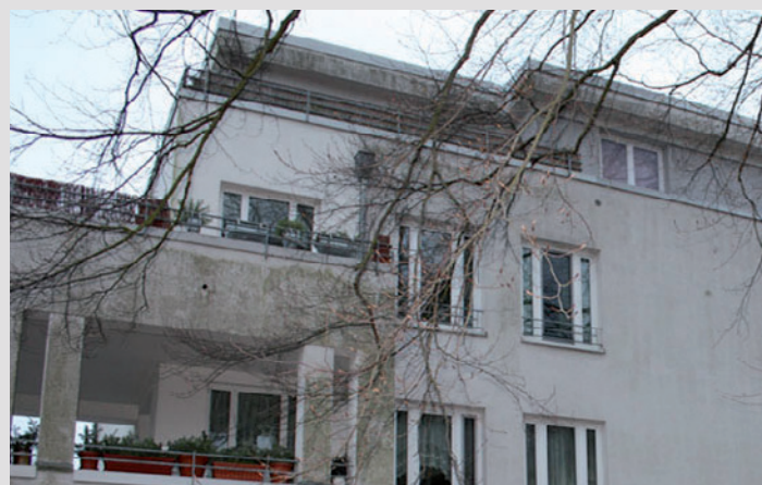
Echantillon avec KefaTherm extérieur sur une façade isolée

La structure microporeuse particulière de KefaTherm Extérieur régule l'humidité et protège par conséquent non seulement contre le développement d'algues et de mousses, mais empêche aussi les dommages comme l'écaillage de la peinture, l'éclatement dû au gel et l'accumulation d'eau. De plus, KefaTherm Extérieur présente des propriétés d'isolation thermique et maintient longtemps les façades propres.