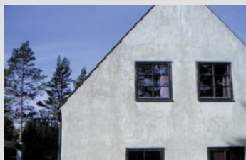
Façade avant la rénovation

Propriétés : effet autonettoyant en cas de pluie, protection contre les dommages dus à l'eau de condensation et aux intempéries, absence d'émissions, isolation thermique et bien d'autres.