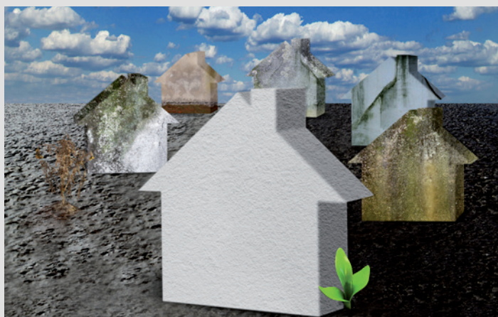
KefaTherm Extérieur - protection façade contre des algues et de mousse

L'enduction microporeuse empêche une accumulation de condensation et protège ainsi contre des algues et de mousse.