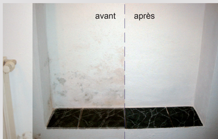
KefaRid élimine la moisissure

Mise en œuvre : KefaRid est un produit fini qui s'applique comme une peinture, au pistolet ou au pinceau/rouleau. La couleur standard est le blanc. KefaRid peut être teinté avec des peintures de couleur vive, à dispersion et solubles dans l'eau.