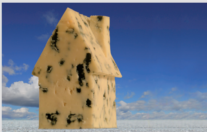
KefaRid, prévention physique de la moisissure