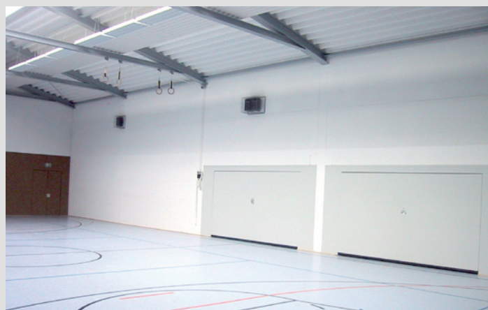
Finition intérieure dans une salle de sport

La structure microporeuse de KefaAkustik permet de conserver des surfaces sèches et sans égouttement, mais aussi d'éviter les dégâts liés à la décomposition atmosphérique, la corrosion et la moisissure. De plus, les composants minéraux atténuent efficacement la vibration propre du matériau et donc le développement de bruit, sans surcharger excessivement les constructions.