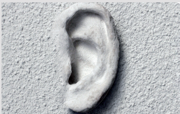
La sécurité pour les oreilles