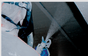
Traitement avec machine airless